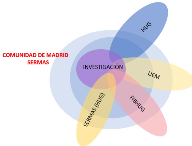
Ilustración 1 Estructura organizativa de la Investigación en el Hospital U. de Getafe

Para lograr este objetivo, se creó el Instituto de Investigación Sanitaria del Hospital Universitario de Getafe (IISGetafe) (ver Anexo 1), fruto de la relación existente entre la propia FIBHUG, el Hospital Universitario de Getafe, la Universidad Europea de Madrid (UEM) y Consejería de Sanidad de la Comunidad de Madrid (Dirección General de Investigación, Formación e Infraestructuras Sanitarias). (Ver Figura 1)