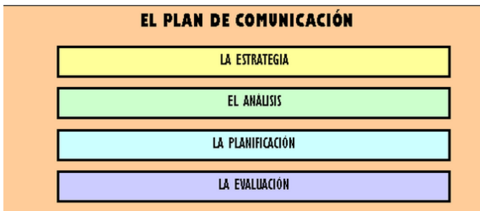
Ilustración 4 Plan de Comunicación de la FIBHUG

La FIBHUG se encuentra en proceso de elaboración de un instrumento que marcará los criterios, políticas y estrategias de comunicación de la institución.